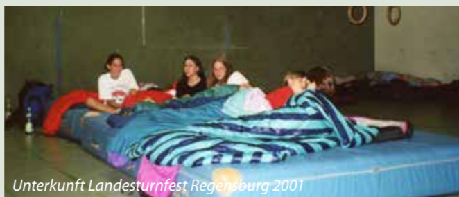
Unterkunft Landesturnfest Regensburg 2001

Natürlich musste auch für Verpflegung gesorgt werden. Zusätzlich gab es auch Vereinsmeisterschaften, die sich großer Beliebtheit erfreuten. Die Höhepunkte waren aber stets die Gau - Bezirk- und Landesturnfeste sowie das deutsche Turnfest. Dort konnte man nicht nur die Vielfalt des Turnsports erfahren, sondern die große Turnfamilie kennenlernen. Das Deutsche Turnfest dauerte stets eine Woche und da gab es viel in der Austragungsstadt zu besichtigen und zu erleben. Unvergessen werden aber jedem Teilnehmer die langen (oder manchmal auch kurzen) Nächte in den Unterkünften bleiben.