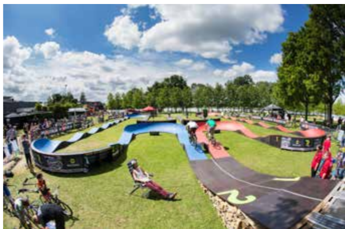
Fun-Track auch für Kinder und Familien; Fun-Track aufgebaut

Ein auf dem Neustädter Kirchenplatz geplanter Fun-Track bringt Sport, Spaß und Gesundheit in Einklang und ist seit 19. Juni bis 4. Juli für alle kostenlos zugänglich. Gemeinsam mit dem Amt für Sport- und Gesundheitsförderung der Stadt Erlangen bietet das City-Management Erlangen einen mobilen, abwechslungsreichen Rundkurs an, der mit Fahrrad, Skateboard, Longboard, Inline-Skates oder Scooter befahrbar ist. Im Laufe des Jahres wird die Anlage auf Erlanger Stadtgebiet noch mehrmals aufgestellt.