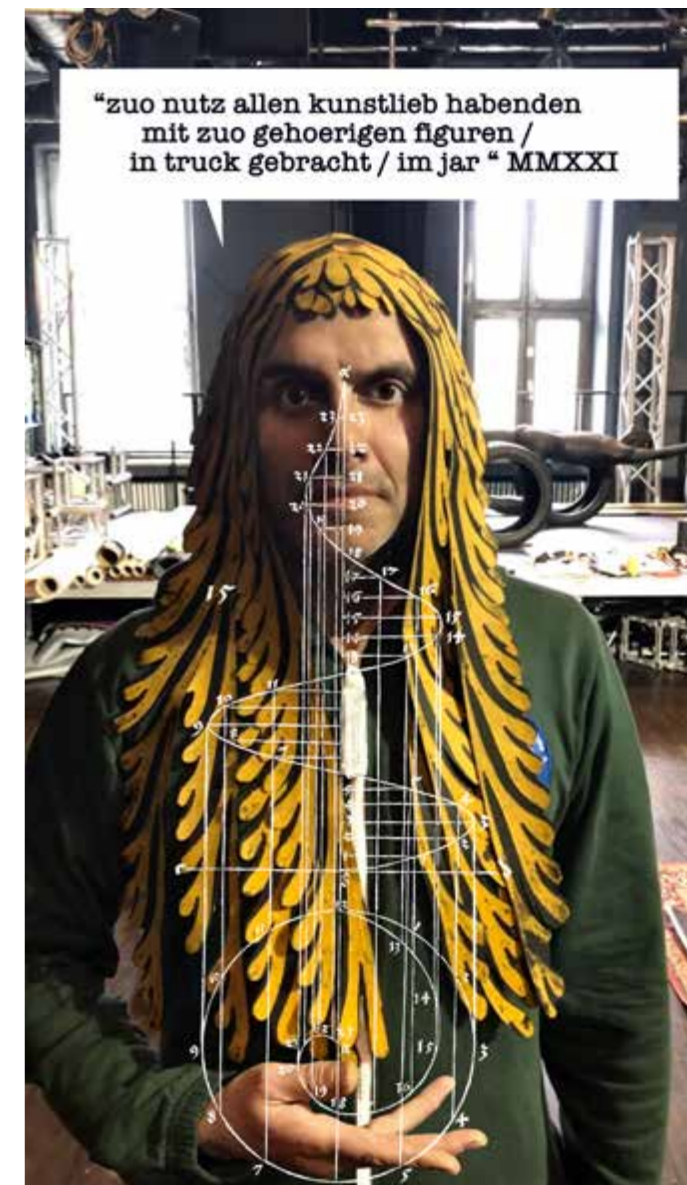
“zuo nutz allen kunstlieb habenden mit zuo gehoerigen figuren / in truck gebracht / im jar “ MMXXI